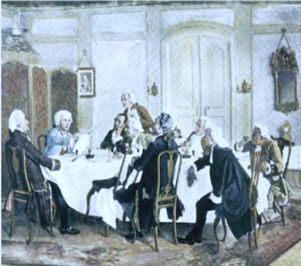
Kant y sus invitados, de Emil Dörstling. (Wikimedia Commons)